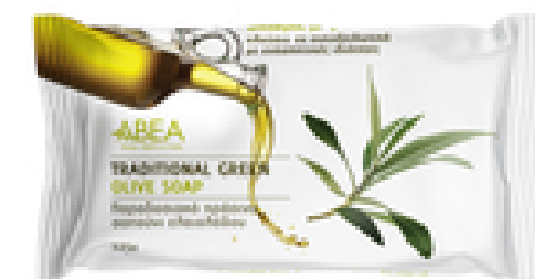
125 g Zelené Olivové Mýdlo 100% přírodní 12 ks / karton