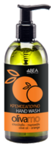
300 ml Tekuté Olivové Mýdlo Pomeranč 12 ks / karton