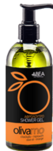
300 ml Olivový Sprchový Gel Pomeranč 12 ks / karton