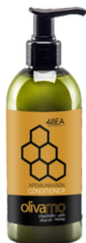
300 ml Olivový kondicionér Med 12 ks / karton