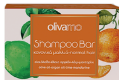
125 g Tuhý olivový šampon pro normální vlasy 12 ks / karton