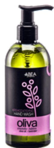
300 ml Tekuté Olivové Mýdlo Levandule 12 ks / karton