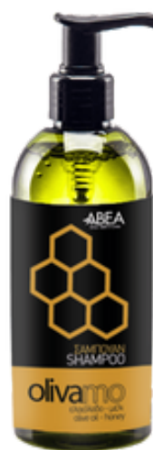
300 ml Olivový šampon Med 12 ks / karton