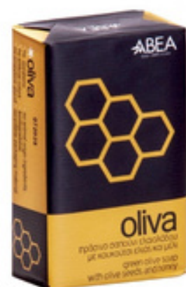
125 g Zelené Olivové Mýdlo Pecky a med 12 ks / karton