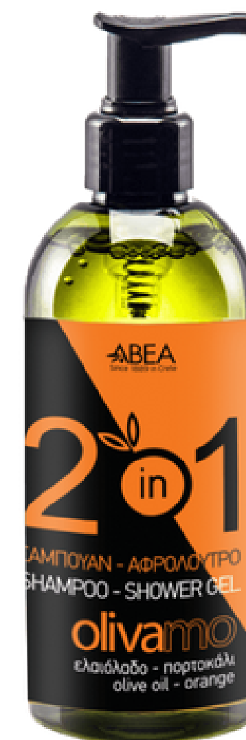
300 ml Šampon a Sprchový Gel 2v1 Přírodní produkt 2v1 pro každodenní hygienu. Obsahuje přírodní extrakt z plodů oliv, olivový olej a pantenol, které přispívají k hydrataci, hebkosti a ochraně pleti i vlasů. Balení: Plastová láhev s dávkovačem. Veganský produkt. Bez parabenů, silikonů a umělých barviv. 12 ks / karton