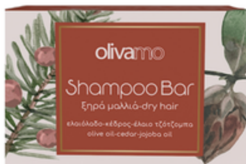
125 g Tuhý olivový šampon pro suché vlasy 12 ks / karton