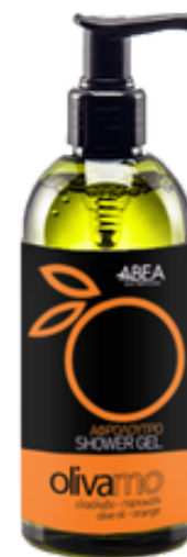
300 ml Olivový Sprchový Gel Pomeranč 12 ks / karton