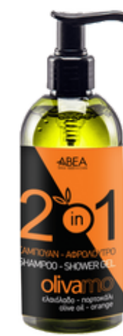
300 ml Šampon a Sprchový Gel 2v1 12 ks / karton