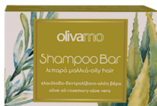
125 g Tuhý olivový šampon pro mastné vlasy 12 ks / karton