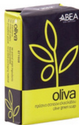
125 g Zelené Olivové Mýdlo 100% přírodní 12 ks / karton